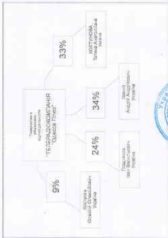
Схематичне зображення структури власності суб'єкта інформаційної діяльності Товариство з обмеженою відповідальністю "ТЕЛЕРАДІОКОМПАНІЯ "Одеса Плюс" ЄДРПОУ 21037467

Генеральний директор (посада уповноваженої особи)